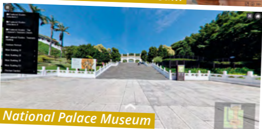
National Palace Museum